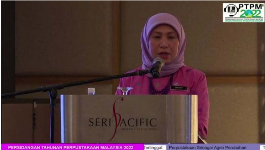
YB Dato' Sri Hajah Nancy Shukri ketika menyampaikan ucapannya sekali gus merasmikan PTPM 2022 di Hotel Seri Pacific, Kuala Lumpur pada hari ini

KUALA LUMPUR, 25 Mei 2022: Persatuan Pustakawan Malaysia (PPM) dengan kerjasama Perpustakaan Negara Malaysia (PNM) menganjurkan Persidangan Tahunan Perpustakaan Malaysia (PTPM) 2022 dari 23 hingga 27 Mei 2022 secara dalam talian. YB Dato' Sri Hajah Nancy Shukri, Menteri Pelancongan, Seni dan Budaya (MOTAC) berkata, "Tiada Sesiapa Yang Tertinggal: Perpustakaan Sebagai Agen Perubahan" menjadi tema PTPM 2022 yang sangat bertepatan dengan peranan perpustakaan dalam komuniti di seluruh negara.