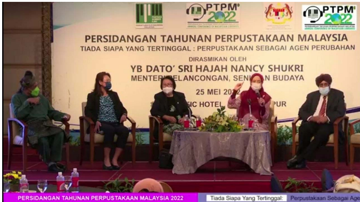
Sidang pleno yang dihadiri oleh wakil dari 4 negara ASEAN yang lain

Selain daripada itu, PTPM 2022 juga menganjurkan Pertandingan Poster daripada tiga (3) kategori utama iaitu Information Scientist (dari academia, industri, perpustakaan dan pelajar pasca-siswazah), Young Explorer (dari universiti dan terdiri daripada pelajar sijil hingga ijazah sarjana muda) dan Junior Wizard (dari sekolah rendah serta menengah dan terdiri daripada guru perpustakaan dan media serta Pengawas Pusat Sumber). Ia dipertandingkan bagi mempamerkan inovasi idea oleh peserta yang mana akan diumumkan senarai pemenang pada Jumaat (27 Mei) nanti.