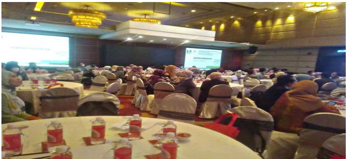
Sekitar berlangsungnya Persidangan Tahunan Perpustakaan Malaysia 2022 di Hotel Seri Pacific, Kuala Lumpur pada hari ini

Selain daripada itu, PTPM 2022 juga menganjurkan Pertandingan Poster daripada tiga (3) kategori utama iaitu Information Scientist (dari academia, industri, perpustakaan dan pelajar pasca-siswazah), Young Explorer (dari universiti dan terdiri daripada pelajar sijil hingga ijazah sarjana muda) dan Junior Wizard (dari sekolah rendah serta menengah dan terdiri daripada guru perpustakaan dan media serta Pengawas Pusat Sumber). Ia dipertandingkan bagi mempamerkan inovasi idea oleh peserta yang mana akan diumumkan senarai pemenang pada Jumaat (27 Mei) nanti.